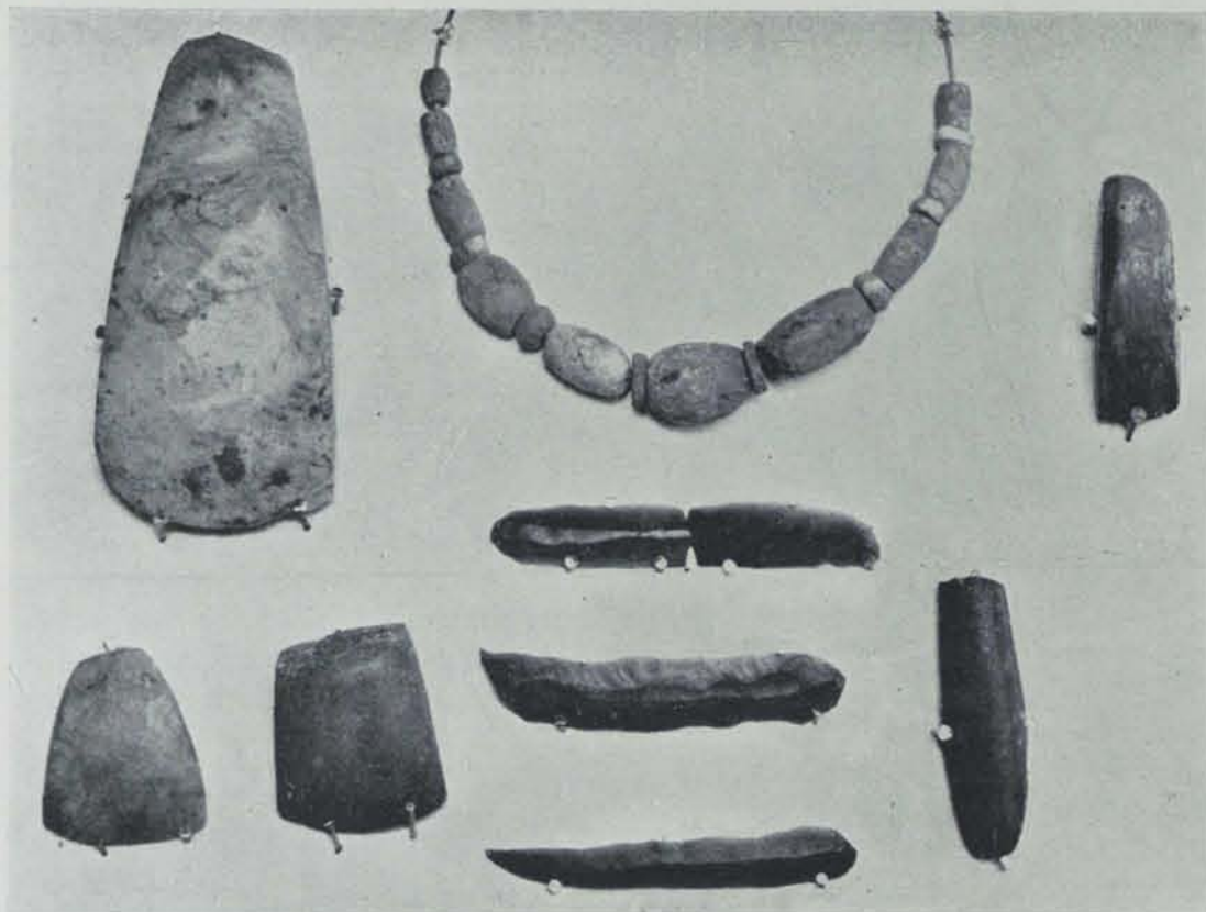
Fig. 21. — Objectes trobats en el sepulcre de Santa Maria de Miralles

Els objectes col·loquen també el sepulcre al final del neolític, contemporani amb estacions en què ja es coneixia el coure, o, més ben dit, a la fase inicial de l'eneolític. Les belles destrals polides, els bells ganivets de sílex i els grans de collar, a més de trobar paral·lels a Los Millares, els