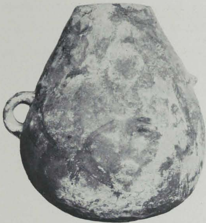
Fig. 18. — Vas d'un sepulcre de Vich

servà, ajagut en posició supina i amb les cames doblegades, de manera que els genolls quedaven en alt i les plantes dels peus s'apoiaven en el sol; el cadàver jeia d'E. a W., amb el cap a llevant. A la seva esquerra es trobà una bella destrala polida, de fibrolita (2), forma trapetzoidal. A la dreta aparegueren dues destrals petites de pedra, trapetzoidals, també de fibrolita, l'una trencada per la part més estreta (0'040 i 0'042 m. respectivament), dues escarpres de forma cilíndrica, de quarçita (0'050 i 0'057 m.), i tres bells ganivets i un fragment d'un quart, tots de sílex i d'excel·lent factura (els dos sencers tenen una llargada de 0'075 i 0'076 m.). A més, es trobà un collar fet de grans de malaquita, que no sabem si estava plegat amb els altres objectes de la dreta del cadàver o si era al coll d'aquest (fig. 21). Els que descobriren el sepulcre diuen que no trobaren res de ceràmica.